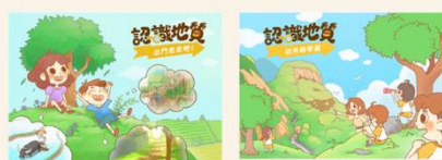
第一本「出門走走吧」 第二本「戶外教學篇」

開發4本AR繪本「地震來了！」，提供AR技術進行地質災害境況模擬技術，享受立體視覺浸淫體驗，以建立學生面對災害時的思維能力與判斷能力，進一步深化防災知識技能。