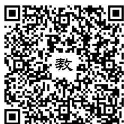
111 年活動教學模組指引連結

https://drive.google.com/file/d/1o9JGUfdYzQyv4L2Omy9GBTe4dA6D-CZE/view?usp=sharing