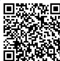
國際文憑課程專班 入學管道