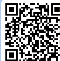
大園高中國際處 FB粉絲專頁