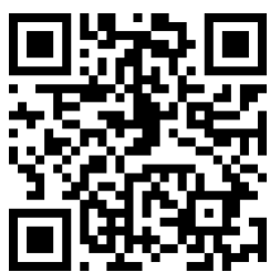
大園高中國際處 官方網站